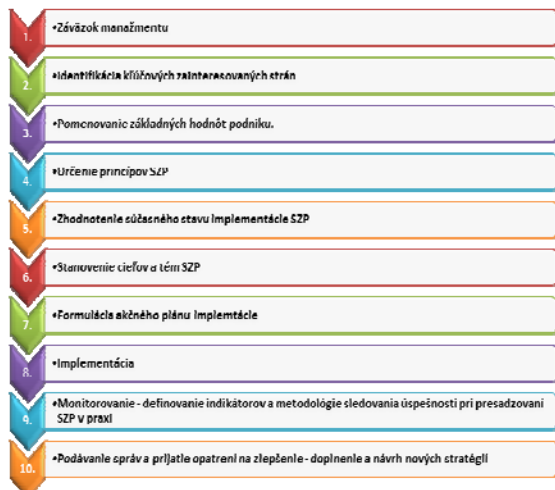
Obr. 4 Kroky implementácie princípov USZP v spoločnosti (vlastné spracovanie podľa http://www.fek.zcu.cz/tvp/doc/akt/24_TVP_2011-2_Vicianova.pdf )

Okrem už spomenutého konceptu Gabriely Hrdinovej doposiaľ neexistuje všeobecne platný model tvorby a implementácie konceptu USZP v praxi. Vo všeobecnosti však môžeme identifikovať 10 krokov implementácie princípov USZP v spoločnosti, obr. 4.