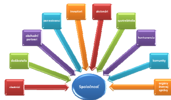
Obr. 2 Zainteresované strany spoločensky zodpovedného podnikania (vlastné spracovanie)

Pojem stakeholders označuje všetky osoby, inštitúcie alebo organizácie, ktoré istým spôsobom vplyvujú na chod spoločnosti, alebo sú chodom spoločnosti ovplyvňované. Zaraďujeme sem: zákazníkov, zamestnancov, verejnosť, dodávateľov, orgány štátnej správy a samosprávy, odbory, reklamné agentúry, finančný trh, banky, médiá, akcionárov, vlastníkov, lokálne ale aj ďalšie komunity a mimovládne organizácie, obr. 6. Bez pravidelného dialógu so stakeholdermi by spoločnosť pôsobila izolovane, pretože každý z nich ovplyvňuje podnikanie organizácie. Prostredníctvom stakeholderov spoločnosť dostáva podnety a informácie, ktoré sú pre tvorbu jej stratégie životne dôležité. Takýto dialóg prináša aj ďalšie pozitívne javy, ako napríklad inšpiráciu či motiváciu k zavádzaniu SZP praktík aj ďalšími subjektmi najmä dodávateľmi a odberateľmi, ( http://www.ekologika.sk/spolocenska-zodpovednost-firmy.html ).