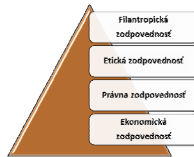
Obr. 1 Carollova pyramída spoločenskej zodpovednosti (spracované podľa: Sakál, P. a kol. autorov, 2009)

Tento model na obr. 1 zobrazuje, že každý podnik by sa mal usilovať posunúť sa od ekonomickej a legislatívnej dimenzie, ktoré sú nevyhnutným základom efektívneho a legálneho fungovania každého podniku k rozvíjaniu etickej a filantropickej dimenzie, (Sakál, P. a kolektív autorov, 2009).